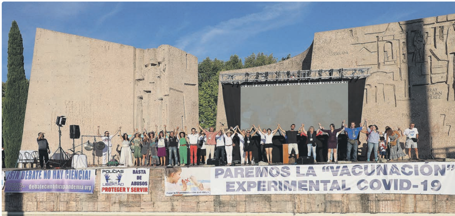
Manifestación contra la vacunación infantil el 4 de septiembre de 2021 en la plaza de Colón