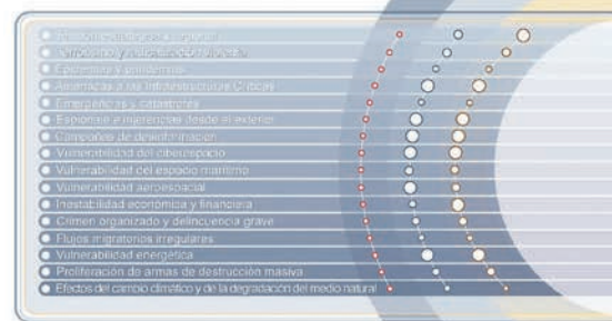
El tamaño del círculo da indicación del grado de correspondencia de cada riesgo y amenaza con la dimensión tecnológica y con las estrategias híbridas