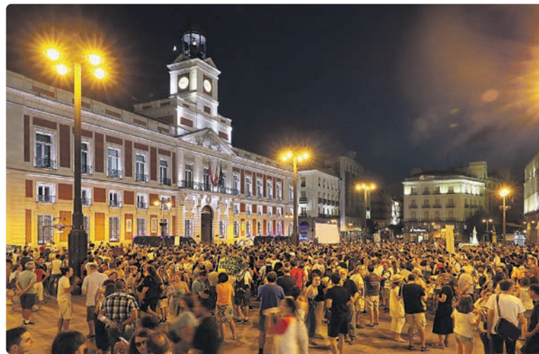
Manifestación del 14 de agosto pasado contra la vacunación covid en los niños que discurrió entre el Ministerio de Sanidad y la Puerta del Sol

Ya no es garantía de nada ser sanitario, ni representar a un partido de izquierdas, ni a un sindicato. Ahora la sumisión que posibilita la instalación de un nuevo fascismo está en todas partes, como también vemos a gentes que se rebelan cuando no pueden aguantar el engrudo maloliente que se les mete a diario por todos los orificios de sus cuerpos anestesiados. Veremos cómo acaba todo esto. No nos jugamos mucho, en realidad nos lo jugamos todo en este envite. ✍