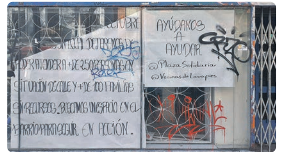
Calle Argumosa esquina Doctor Fourquet.

El perfil de la vulnerabilidad en Madrid se ha modificado. 1 de cada 3 hogares se ha empobrecido. Y en