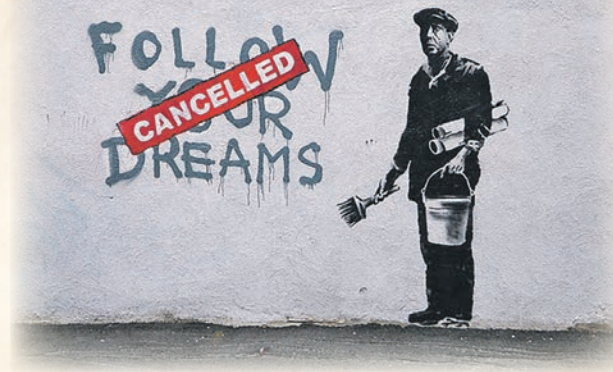
Dibujo de Banksy en Boston

Espero que cada uno obtenga lo que merece de todo esto y que lo disfrute en 2021. ✍