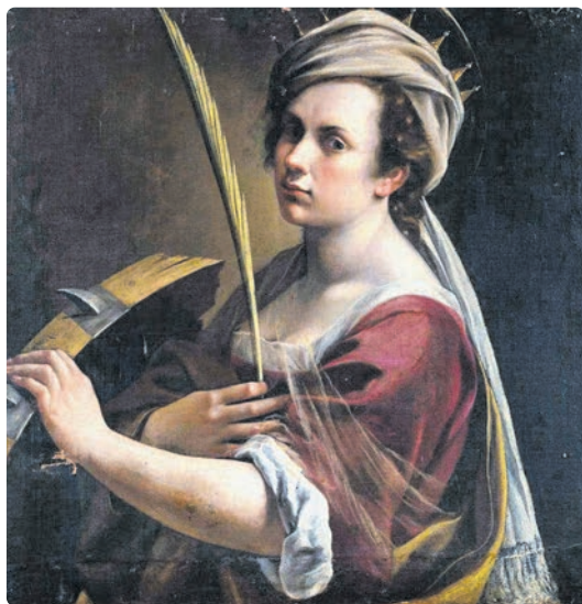
Autorretrato de Artemisia Gentileschi