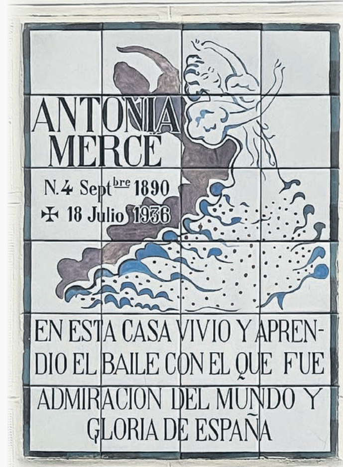
Placa en la calle del Olmo, 25, recordando que allí vivió Antonia Mercé

Trabajó con músicos de la talla de Manuel de Falla, Enrique Granados o Isaac Albéniz; folcloristas como García Lorca; maestros del flamenco como Miguel de Molina o el propio