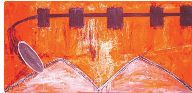
La pensadora de Mondrian, de Paco Leal

La Familia Lavapiés fue un grupo de activistas en el ámbito político y artístico, que consideraban el arte, especialmente la pintura, como herramienta para la lucha política. Realizaron múltiples acciones entre la performance , el happening , la acción parateatral callejera, exposiciones, publicaciones..., acercándose a la cultura popular y el emergente rock ibérico. Lavapiés era un oasis de pensamiento y acción alrededor del movimiento vecinal, el estudiantil y el obrero; un crisol presidido por un Rastro donde la expresión ciudadana estaba permanentemente presente sin las paradas de ropa vintage traída de otras latitudes ni las artesanías industriales. Aún quedan algunos de aquellos artesanos con su puesto en el mismo lugar de siempre. LFL, que tenía su hogar en un piso de la calle Embajadores, 50, un edificio (1970) de reciente construcción entonces, lo había convertido en un seminario permanente de discusión sociopolítica, una factoría de artesanía popular y un centro de producción artística. Tenían su puesto en la Ribera de Curtidores, junto a las escaleras –gradas del Rastro, que, por cierto, se construyeron unos años antes y fueron usadas y personalizadas por los grupos