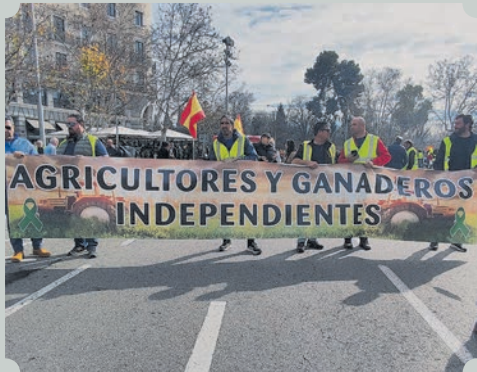
Tractorada del 21 de febrero ▼