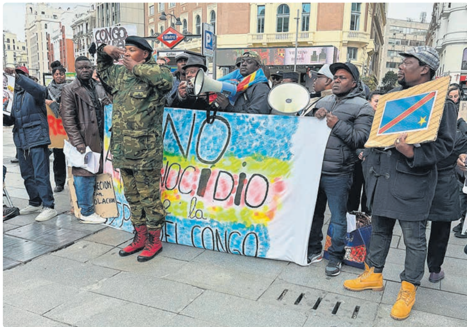
Concentración en Callao