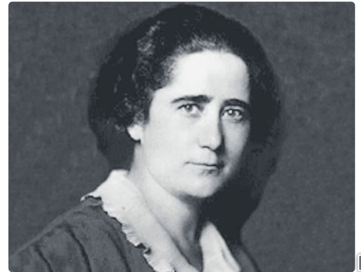
Clara Campoamor.

en la política española. Es reconocida por su incansable defensa de los derechos de la mujer y su papel fundamental en la consecución del sufragio femenino en España. A lo largo de su carrera, logró varios hitos significativos: