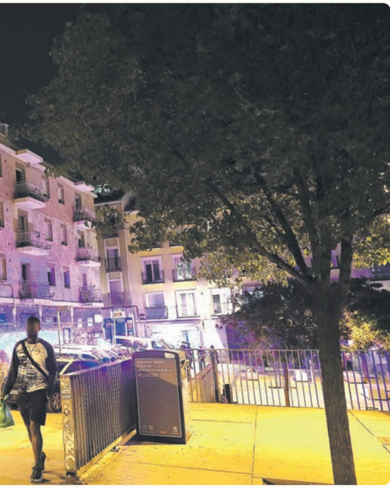
Edificio de La Quimera custodiado por la policía tras haber sido desalojado el 21 de septiembre pasado

se degraden y, con esta actitud, hacen avanzar a los partidos de derechas. Es importante dignificar el barrio que habitamos.