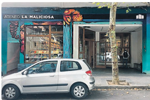
Ateneo La Maliciosa

No nos quedamos a la sesión de la tarde, ya que priorizamos la asistencia a una manifestación en la que distintos colectivos denunciaron que se está perpetrando un tratado con la OMS que supone una cesión absoluta de soberanía sanitaria, con la excusa de pandemias presentes y futuras. ✍