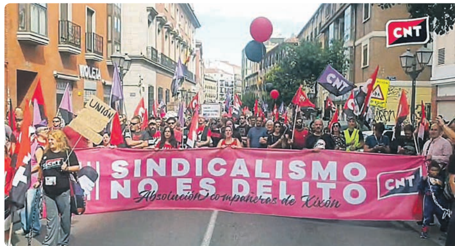
Manifestación de la CNT en Madrid el pasado 24 de septiembre

Después de que nos metieran a todos en casa por la fuerza y al dictado de los grandes laboratorios, que tenían que vender como vacunas preparados infames que no solo no sirvieron para nada, sino que parece que pueden ser la causa de la sobremortalidad no explicada que todo el mundo reconoce en este momento, después de todo eso, las reivindicaciones y las pancartas han quedado muy debilitadas.